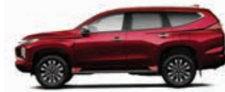
Medium Red Mica (P17)