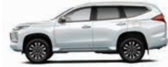
White Diamond (W85) YENI