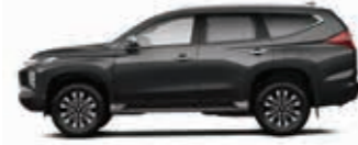
Graphite Gray Metallic (U28) YENI