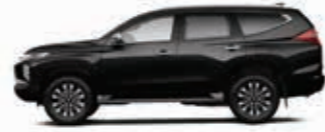
Jet Black Mica (X37)