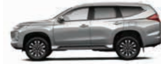
Sterling Silver Metallic (U25)