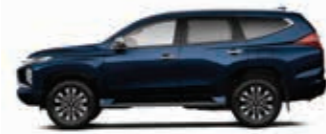
Deep Blue Mica (T64)