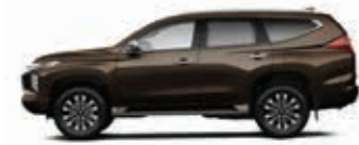
Deep Bronze Metallic (C17)